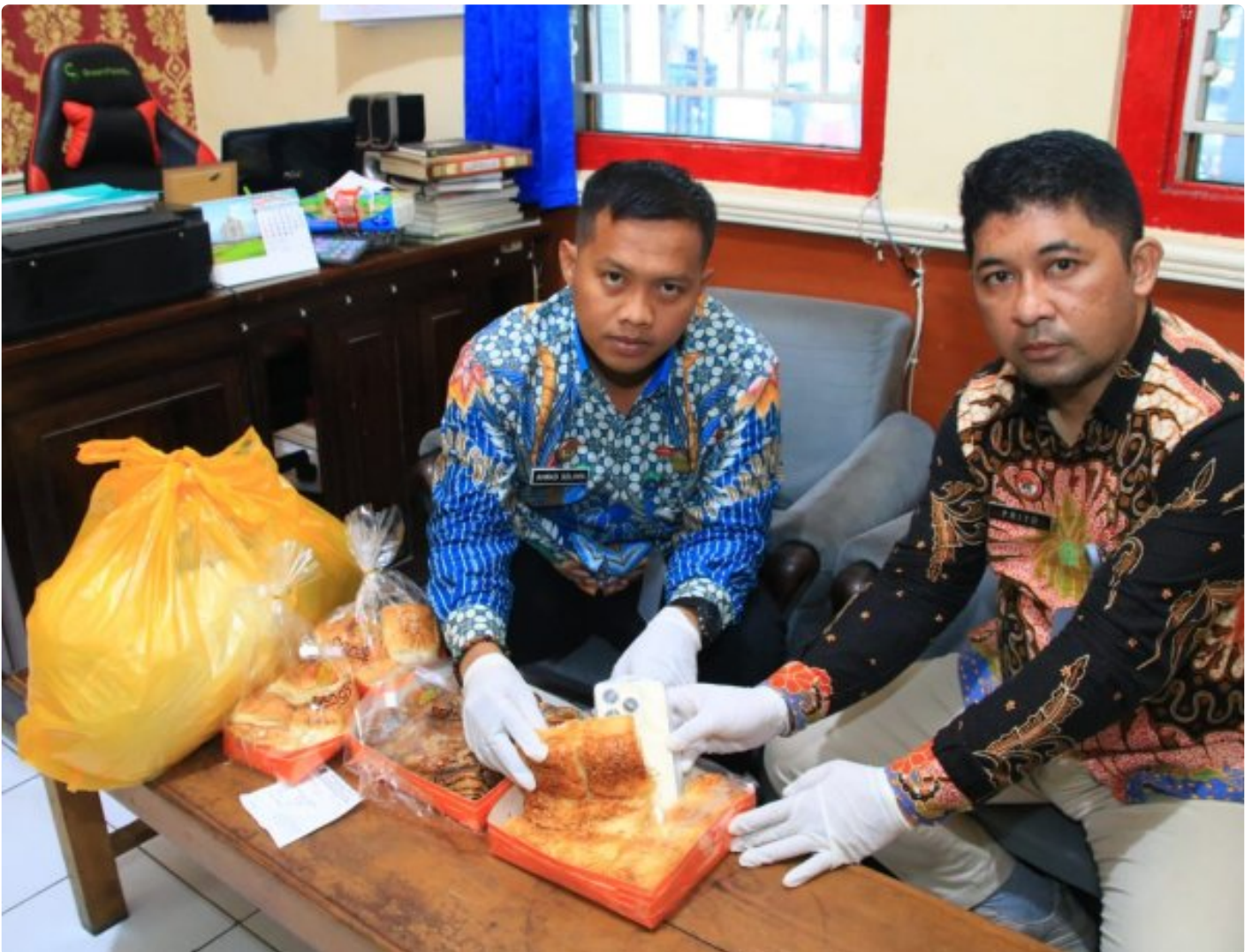
Petugas Lapas Banyuwangi berhasil menggagalkan penyelundupan HP ke dalam lapas

BANYUWANGI - Petugas Lembaga Pemasyarakatan (Lapas) Kelas IIA Banyuwangi berhasil menggagalkan upaya penyelundupan handphone ke salah satu narapidana, Sabtu (18/1/2025). Handphone itu akan diselundupkan oleh B